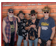
Creedance Clearwater Revived

Stand Juni 2025 / Änderungen vorbehalten